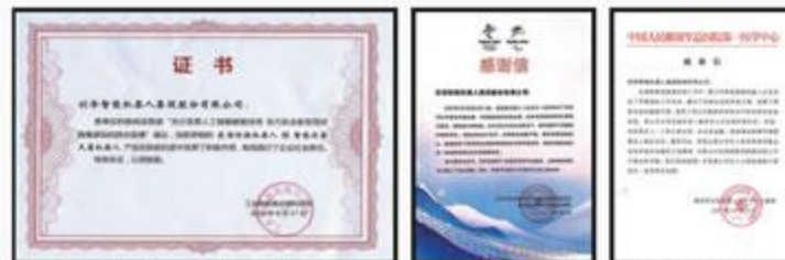
被工信部授予科技领域“抗疫标兵” 2022北京冬奥会感谢信 301医院感谢信