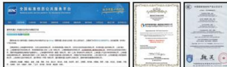
创译集团参与制定《服务机器人机械安全评估与测试方法》 国际CMMI 5认证 产品CCC证书