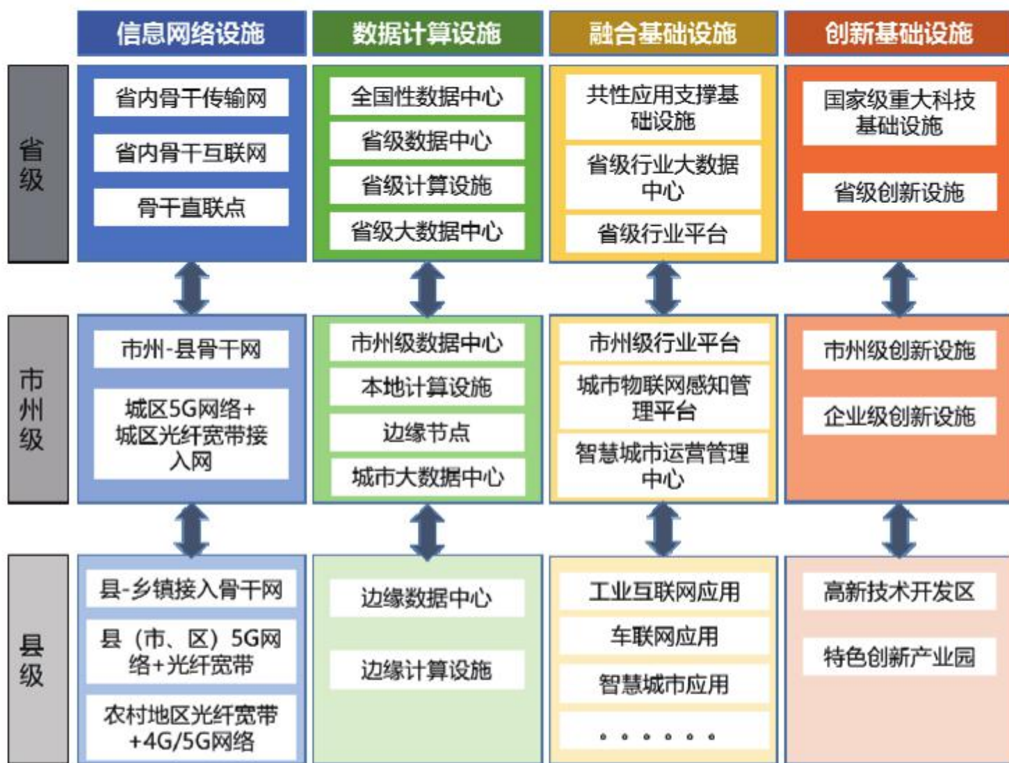
图 2—2 省新型基础设施层级架构

县级层面。 建设完善县—乡镇接入骨干网，加快推进县（市、区）5G网络和千兆光网覆盖，有序推进行政村5G网络和千兆光网建设。县（市、区）主要根据需求建设边缘数据中心和边缘计算设施。积极参与市州级融合基础设施建设，充分利用省、市州共性支撑能力，发展智慧化特色应用。结合各地特点建设高新技术开发区、特色产业园等创新设施载体。配合新型基础设施建设，同步建设网络安全防护软件和设备。