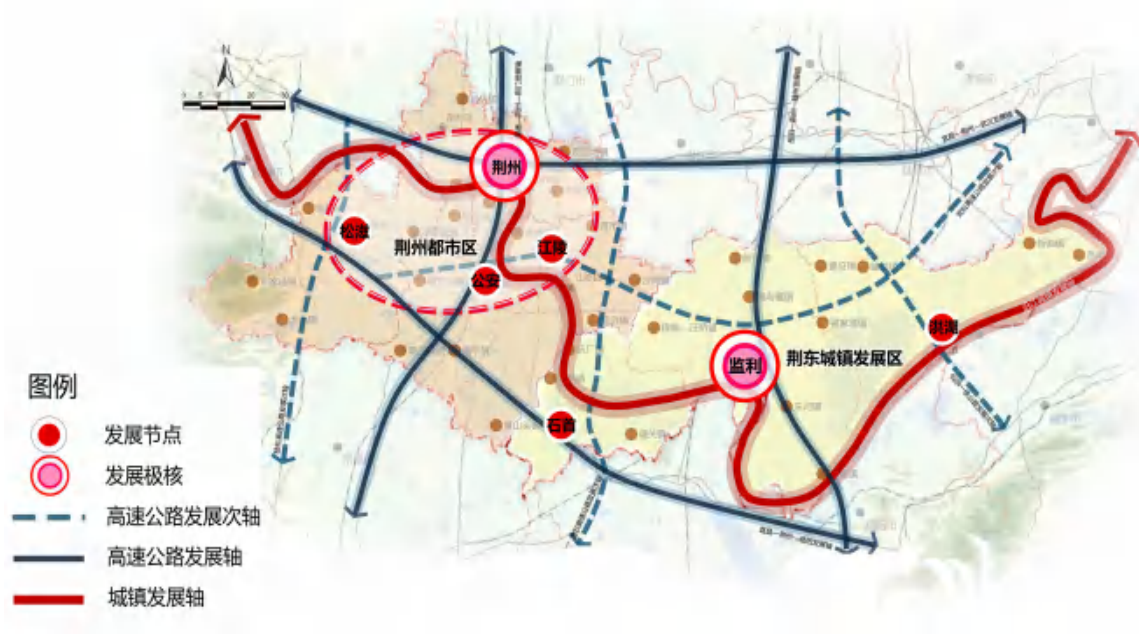
图 5-1 区域发展格局图

加强与相关规划的衔接，实施“东接、西合、南融、北联”战略，构建“一带两区、一主一副、多轴多点”空间格局，形成定位科学、分工合理、层次清晰的区域发展格局。