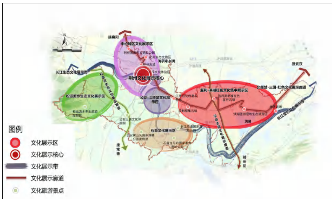
图 3-1 文旅产业布局图

建设两湖平原科技服务中心。发挥科教资源优势和企业主体创新作用，构建覆盖科技创新全链条、产品生产全周期的科技服务体系。聚合各种科技资源，集成在荆高等院校、科研院所等相关力量，组建国家、省级实验室和工程研究中心、企业技术中心和研发中心，形成一批集研究开发、设计、制造于一体，具有较强竞争力的骨干企业。组建一批产业联盟，协同开展行业创新，整体提升产业科技含量。支持发展软件和信息服务业，在高新区建设数字经济产业园。支持监利华中光电产业园建设，打造光电子产业联盟。建立健全软件工程、软件测评、软件质量保障等第三方服务体系，持续加大知识产权保护力度，推动软件产业健康发展。