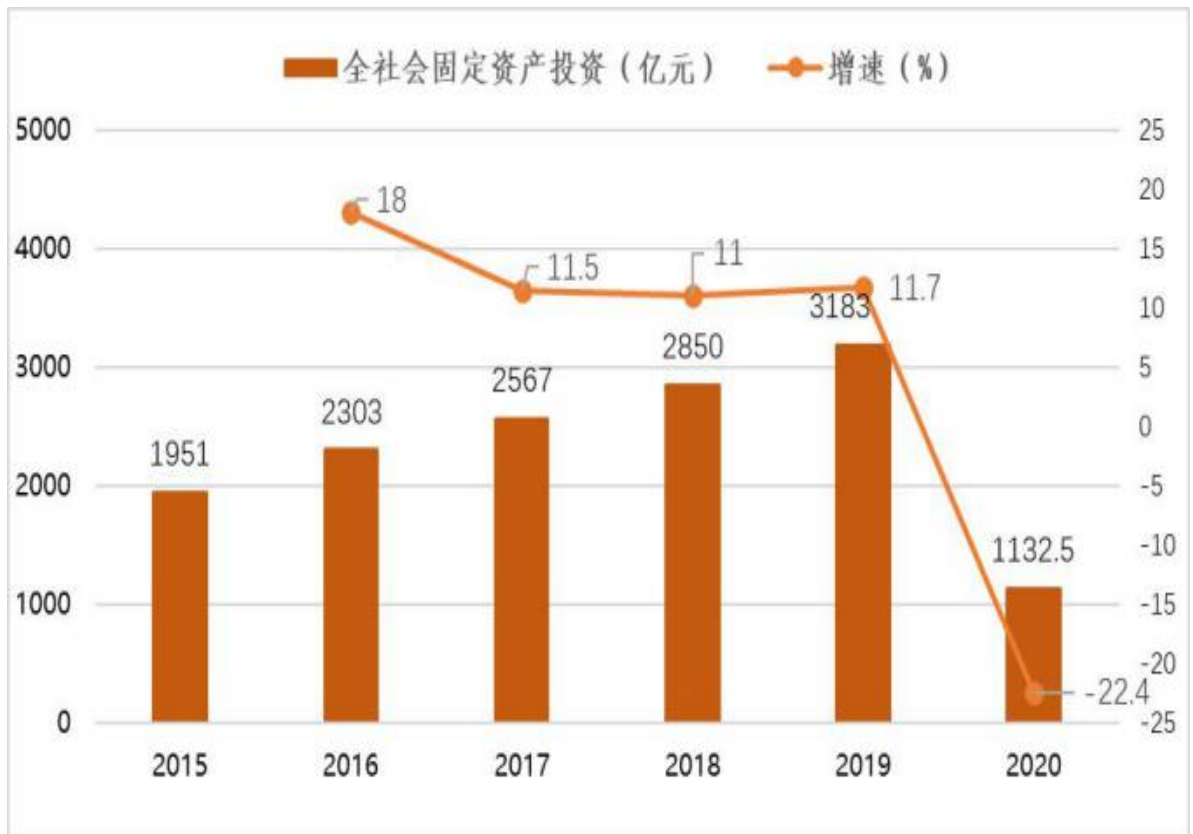
图 1-3 2015-2020 年全社会固定资产投资情况

综合交通体系加快形成。浩吉铁路荆州段开通运营，铁路通车里程增至 219 公里。建成荆州长江公铁大桥、石首长江大桥、洪湖嘉鱼长江大桥。洪监、沙公、潜石、江北高速建成通车，高速公路通车里程增至 714 公里。建成一、二级公路 941 公里。新改建农村公路 7543 公里。盐卡、松滋车阳河、江陵郝穴港多式联运体系逐步完善。荆州沙市机场通航。铁路“十字交叉”、高速“五纵三横”“一江五桥”“一港九区”的综合立体格局基本形成。