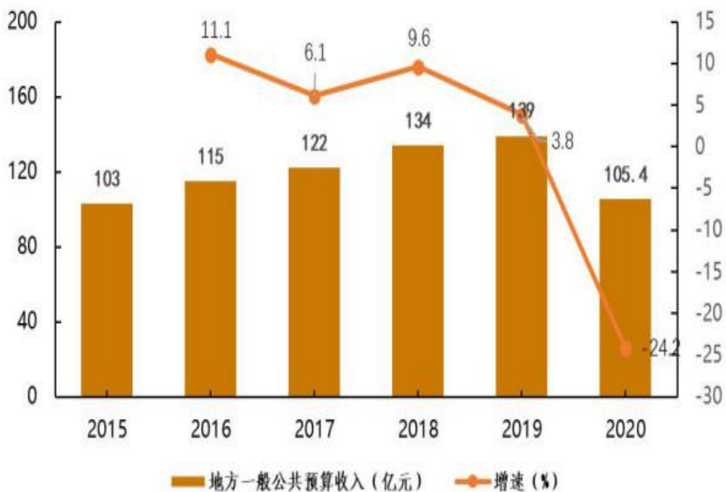
图 1-4 2015-2020 年地方一般公共预算收入增长情况

续改善，市场活力进一步释放，“互联网+放管服”改革领跑全省，行政审批事项不断精减，时限大幅压缩，部门职能进一步明确。减税降费政策全面落实，累积减负 55 亿元。湖北自贸试验区荆州协同区获省政府批复，荆州综合保税区建设上报国务院，外资综合服务中心揭牌。监利获批撤县建市。