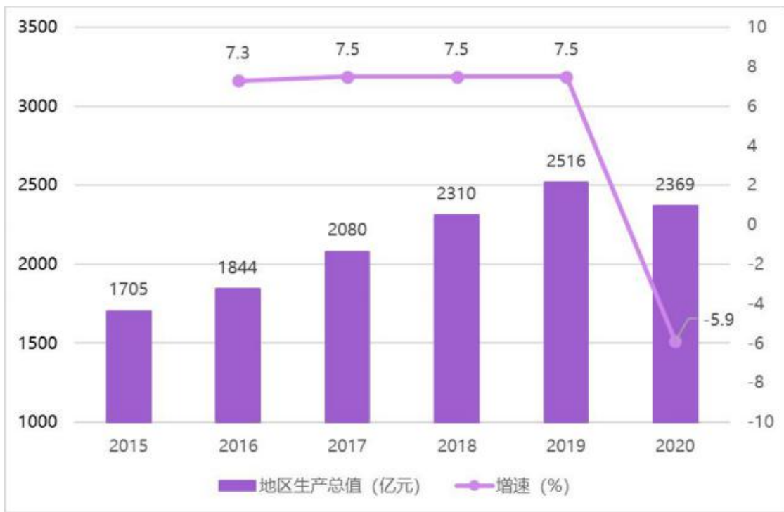
图 1-1 2015-2020 年地区生产总值增长变化情况

强，占全市规上工业总产值比重 7%；建成 10 个省重点成长型产业集群；“千企千亿”技改工程加速推进，“百领”企业、隐形冠军企业大幅增加，境内外上市企业总数达到 9 家。农业优势巩固提升，现代农业迈出新步伐，粮食产量连续 5 年稳定在 90 亿斤，形成优质粮棉油、果蔬、畜禽、水产、林纸等 7 大加工产业体系；新型经营主体成为主力军，国家级龙头企业 7 家，省级龙头企业 88 家；美丽乡村加快建设，国家级特色小镇 1 个，省级特色小镇 4 个，省级美丽乡村试点村 116 个、示范村 146 个、整治村 557 个。现代服务业形势喜人，全域旅游提档升级，方特园、园博园、荆州海洋世界等一批文旅项目建成运营。服务业市场主体蓬勃发展，电子商务、新兴零售、现代物流发展迅猛；金融机构新增贷款持续增加，有力支撑实体经济发展。