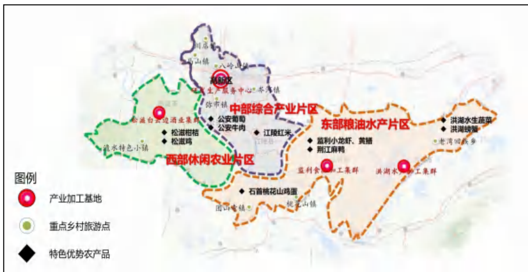
图 6-1 现代农业布局图

复、农业污染防治等重点项目建设，实施“藏粮于地、藏粮于技”荆州战略。开展绿色农田创建示范，支持鸭蛙香稻生产基地、稻鱼生态综合种养基地建设，打造“宜业宜居宜游”绿色生态田园。支持水稻、棉花、油料生产基地建设。根据市场形势，调整棉花种植面积；协调落实中央优质粮食工程、产粮大县奖励、产油大县奖励政策、国家油料基地建设等工程，稳定粮食生产，扩大油菜种植面积。到 2025 年，建成高标准农田 800 万亩，主要粮食作物种植面积稳定在 1000 万亩，油料种植稳定在 300 万亩，棉花种植稳定在 50 万亩水平。