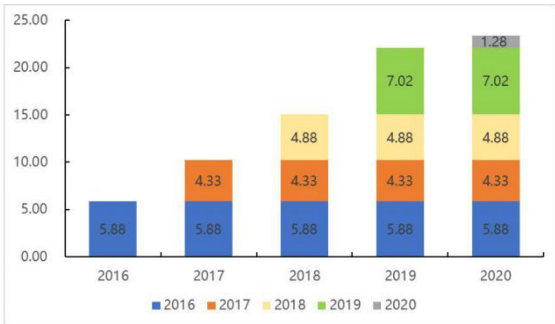
图 1-2 2016-2020 年农村脱贫人口情况（单位：万人）

“三大攻坚战”成效显著。扎实推进长江大保护“双十”工程，连续两年考核位居市州前列。十大标志性战役初战告捷，码头整治强力推进，非法采砂有效遏制。污染防治力度空前，能耗“双控”目标提前完成，获批全国第二批黑臭水体整治示范城市，航道疏浚弃砂综合利用模式在长江全流域推广。生态修复深入实施，五年植树造林 230 万亩，成功创建国家森林城市。长江大保护十大战略性举措快速推进，58 个重大事项和 3 个重点项目落地见效，“万里长江美在荆江”新画卷正在形成。精准扶贫、精准脱贫任务如期完成，全面落实“两不愁三保障”，贫困户危房改造、易地扶贫搬迁基本完成，贫困户饮水安全达标率 100%，371 个贫困村、131494 户、400524 人已脱贫出列，脱贫攻坚取得决定性成就。多措并举化解重大金融风险，区域性系统性金融风险平稳可控，连续十年获得全省金融信用市州称号。