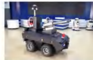
室外智能消毒机器人