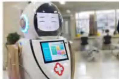
全自动智能消毒杀菌机器人