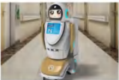
多功能消毒机器人