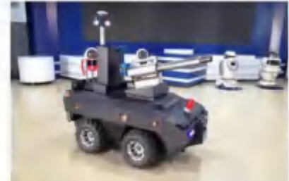
室外智能消毒机器人