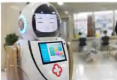
全自动智能消毒杀菌机器人