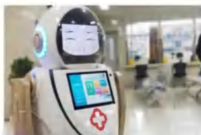
全自动智能消毒杀菌机器人