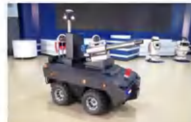
室外智能消毒机器人