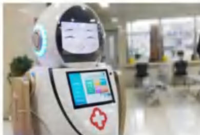
全自动智能消毒杀菌机器人