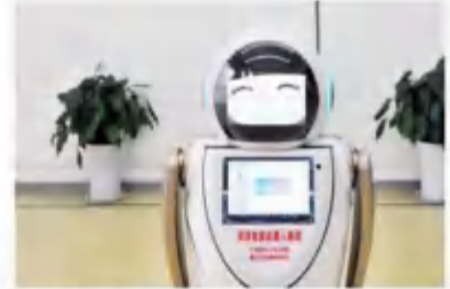
智能医用消毒机器人