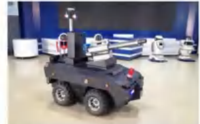
室外智能消毒机器人