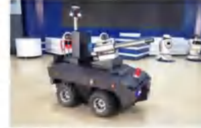
室外智能消毒机器人