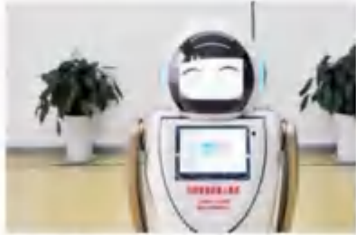
智能医用消毒机器人