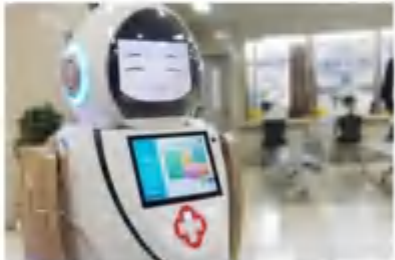
全自动智能消毒杀菌机器人