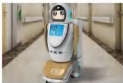
多功能消毒机器人