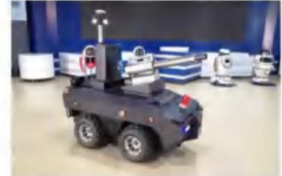
室外智能消毒机器人