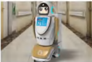
多功能消毒机器人