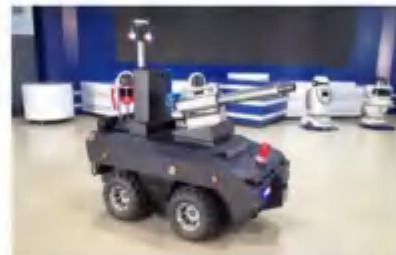
室外智能消毒机器人