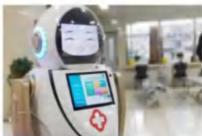
全自动智能消毒杀菌机器人