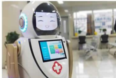
全自动智能消毒杀菌机器人