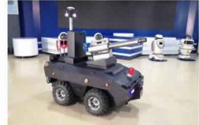
室外智能消毒机器人