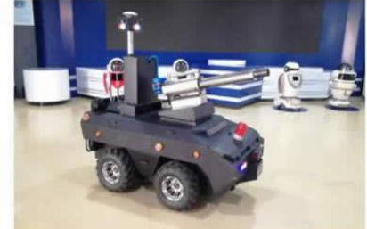
室外智能消毒机器人