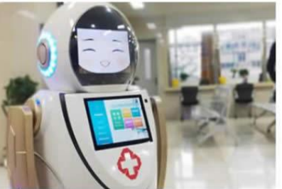
全自动智能消毒杀菌机器人